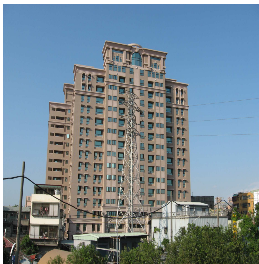
瓊林路社區住戶意見整合順利，於 94.5.10 完成拆除，新建物於 97 年興建完工，為 15 層住宅大廈

綜合以上所述，國內發生污染建築物事件後，已積極訂定「放射性污染建築物事件防範及處理辦法」，據以收購改善污染建築物、辦理居民免費健康檢查及長期追蹤，且評定宜予拆除之污染建