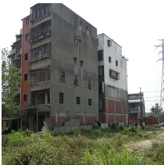
瓊林路社區共 35 戶、32 戶為污染建築物，原能會收購 20 戶

以新北市新莊區瓊林路一處 2 棟 5 層樓共 35 戶的社區為例，該社區計有 20 戶原能會收購的污染建築物，93 年由住戶重建委員會主動發起污染建築物拆除重建更新作業，經全體所有權人達成共識，並由國有財產署將瓊林路社區中收購污染建築物之所有土地持分，讓售予住戶重建委員會進行重建，該社區已於 97 年順利完成改建為 15 層住宅大廈。