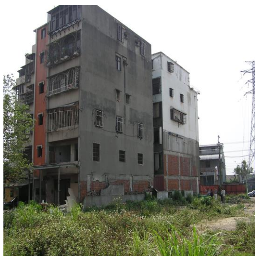
瓊林路社區共 35 戶、32 戶為污染建築物，原能會收購 20 戶

以新北市新莊區瓊林路一處 2 棟 5 層樓共 35 戶的社區為例，該社區計有 20 戶原能會收購的污染建築物，93 年由住戶重建委員會主動發起污染建築物拆除重建更新作業，經全體所有權人達成共識，並由國有財產署將瓊林路社區中收購污染建築物之所有土地持分，讓售予住戶重建委員會進行重建，該社區已於 97 年順利完成改建為 15 層住宅大廈。