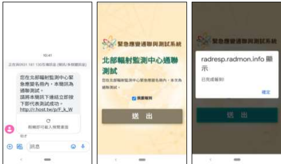
圖二 緊急應變通聯與測試系統-簡訊回報流程圖