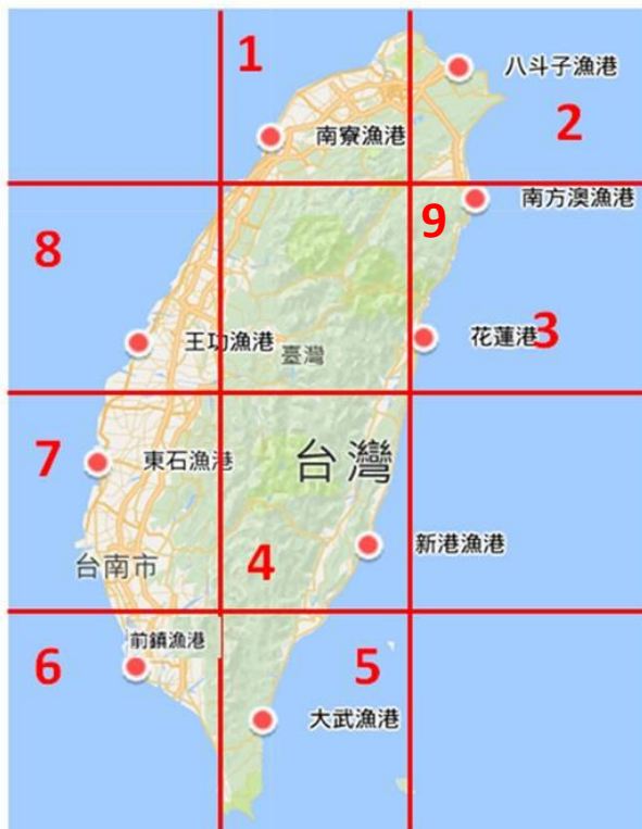
圖1 台灣沿岸海水取樣點