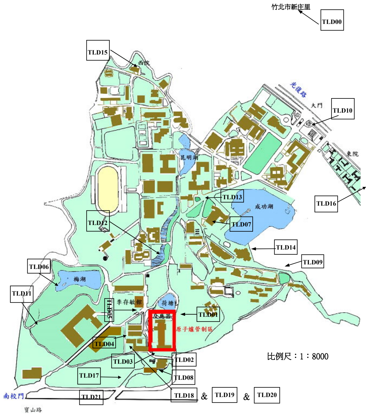
圖 1.3 國立清華大學環境輻射監測取樣位置圖(累積劑量率)