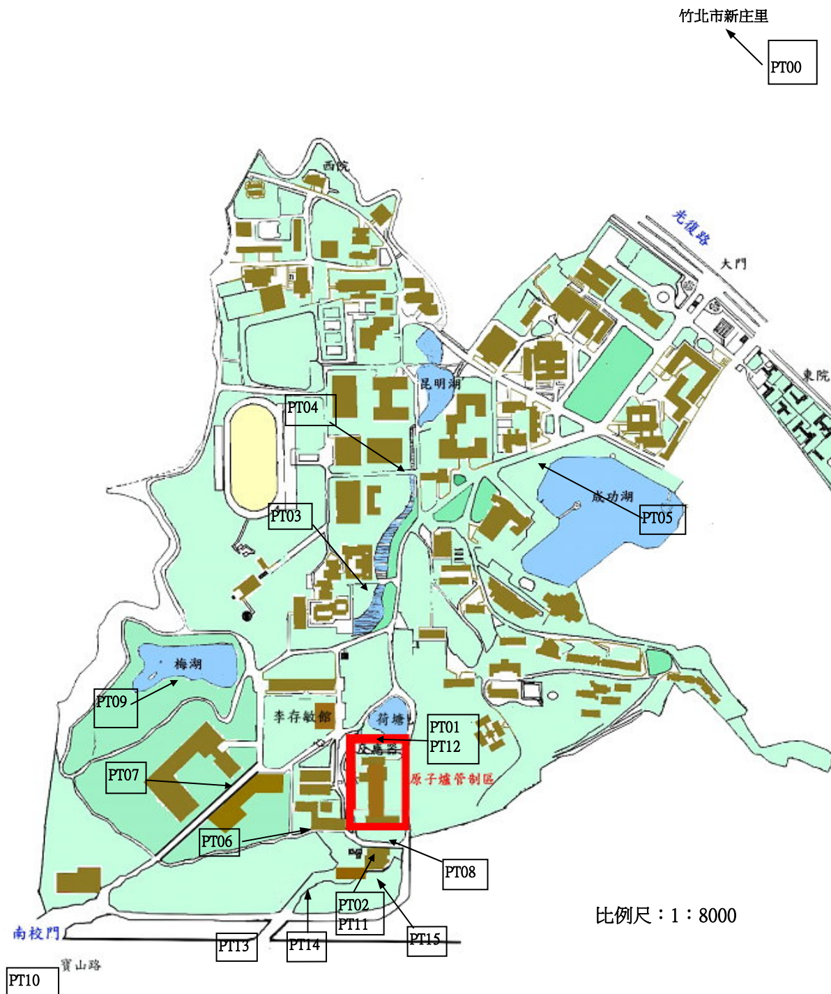
圖 1.6 國立清華大學環境輻射監測取樣位置圖(植物試樣)