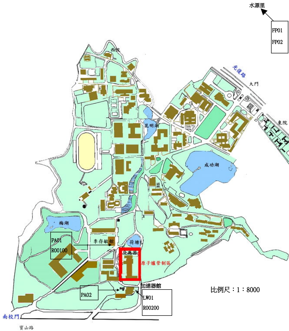
圖 1.2 國立清華大學環境輻射監測取樣位置圖(連續劑量率、空浮微粒、落塵、農產品)