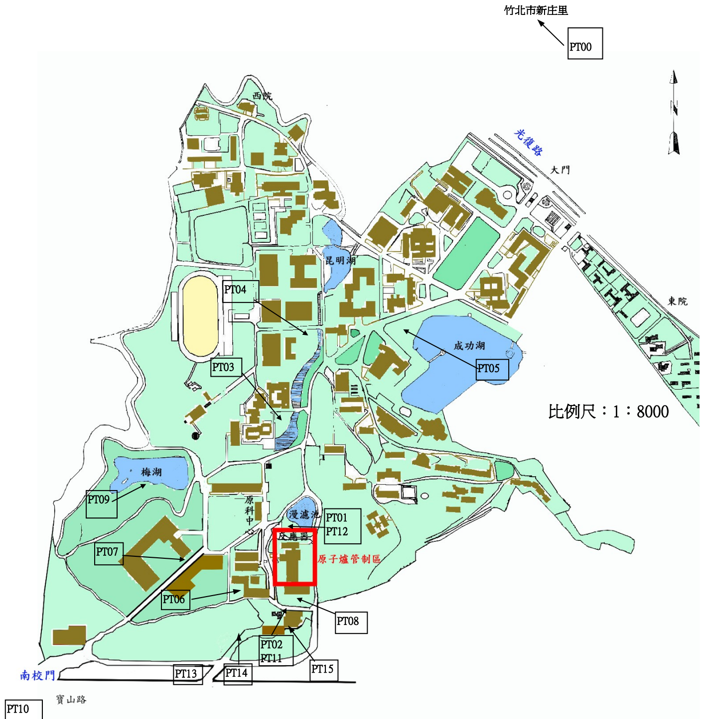
圖 1.6 國立清華大學環境輻射取樣位置圖(植物試樣)