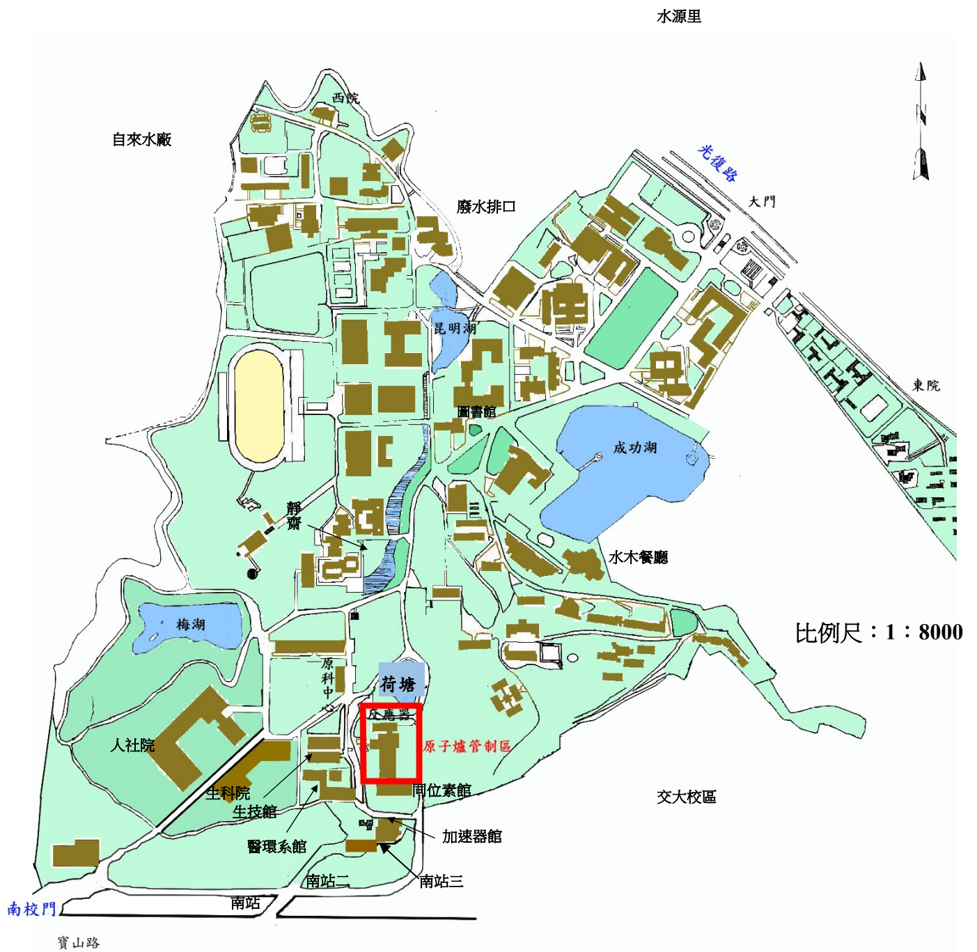
圖 1.1 國立清華大學環境輻射取樣位置圖