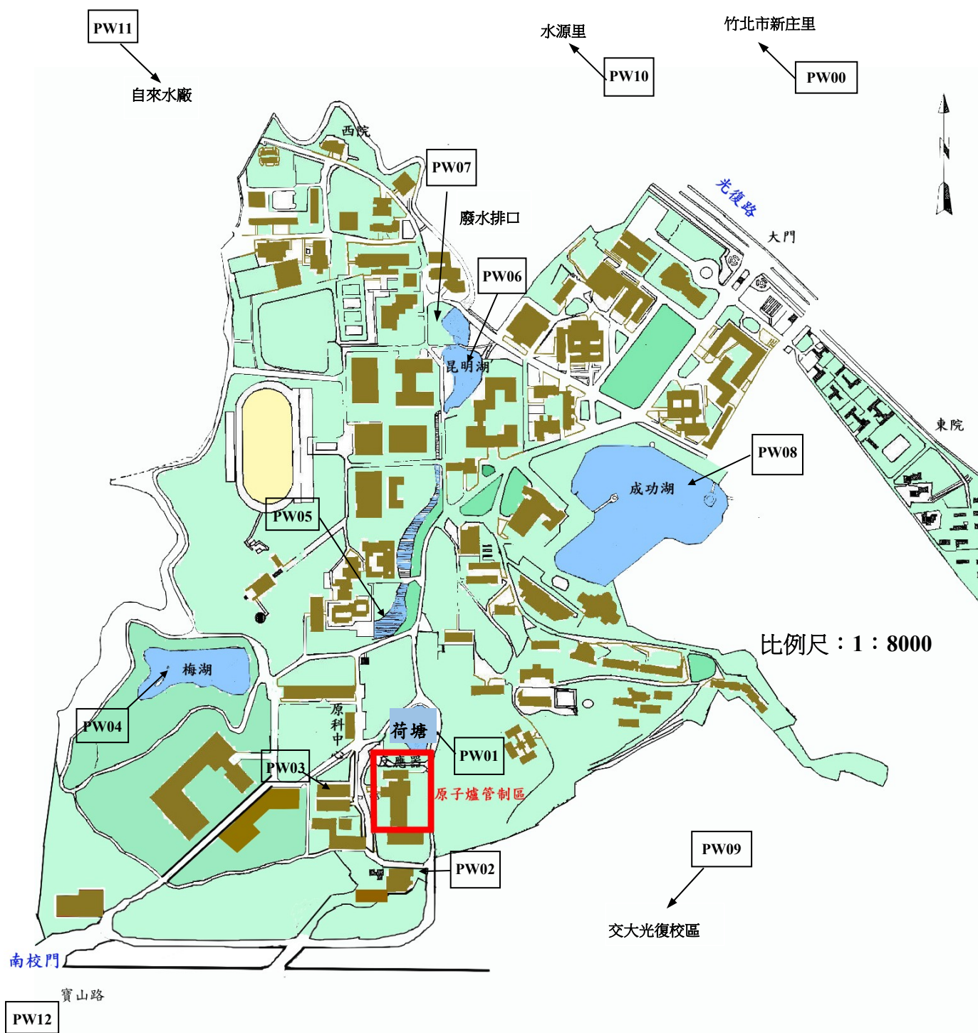
圖 1.5 國立清華大學環境輻射取樣位置圖(水試樣)