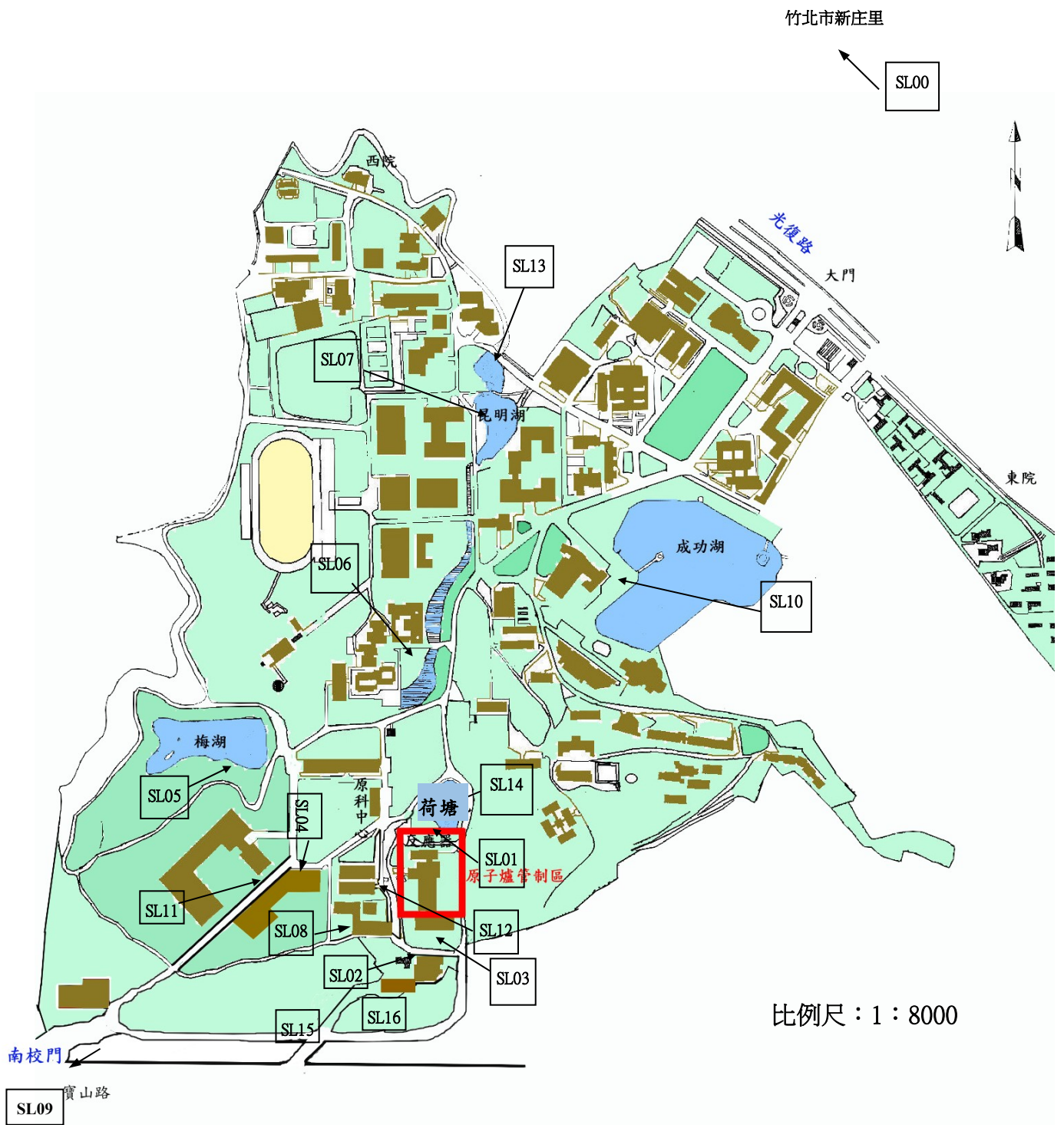
圖 1.4 國立清華大學環境輻射取樣位置圖(土壤及底泥)