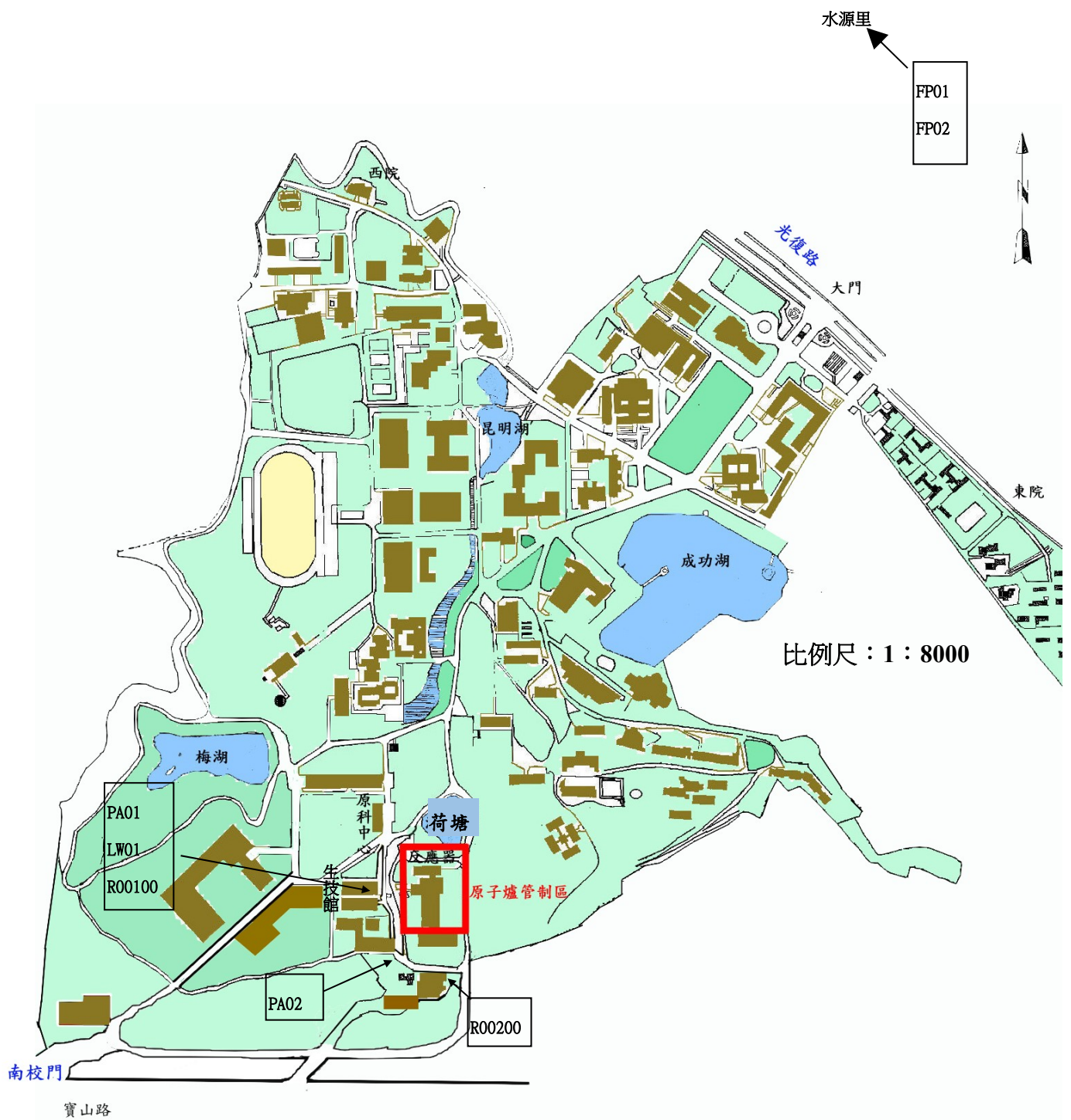
圖 1.2 國立清華大學環境輻射取樣位置圖(連續劑量率、空浮微粒、落塵、農產品)