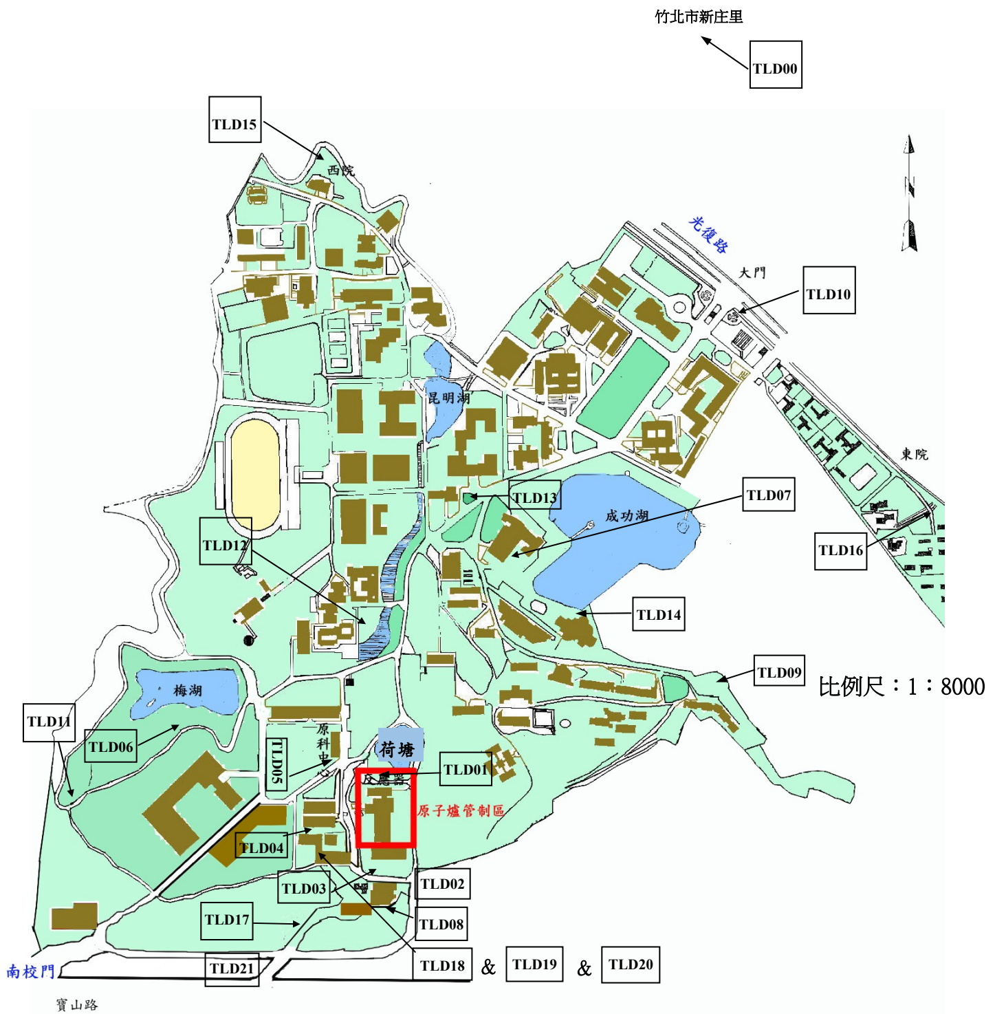
圖 1.3 國立清華大學環境輻射取樣位置圖(累積劑量率)