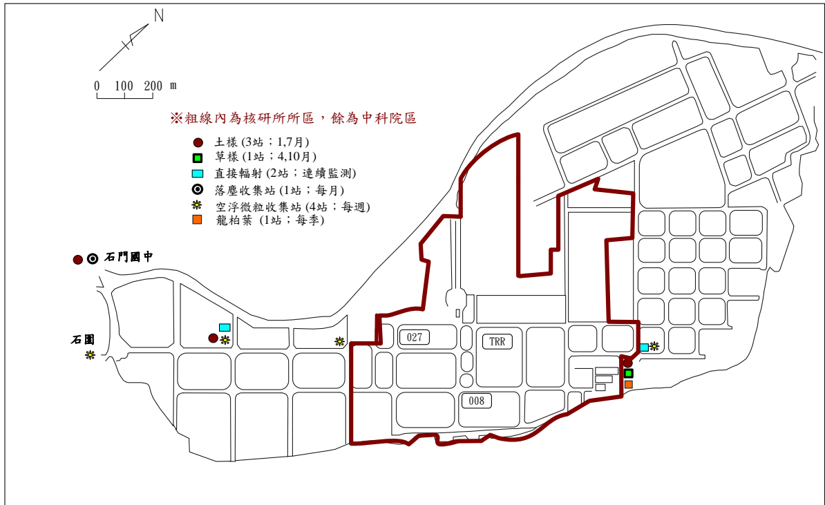
圖 1-1：核能研究所場所外直接輻射、空浮微粒、落塵、草、表土及龍柏葉等取樣點位置圖