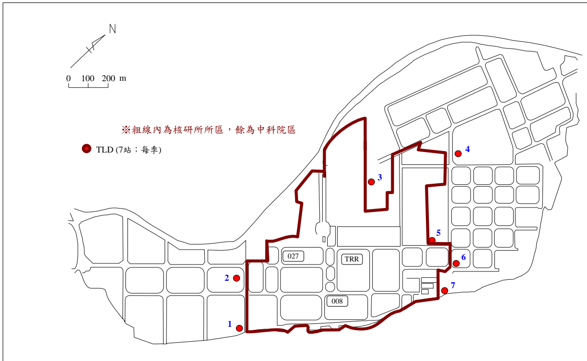
圖 1-2：核能研究所場所外熱發光劑量計(TLD)位置圖(一)