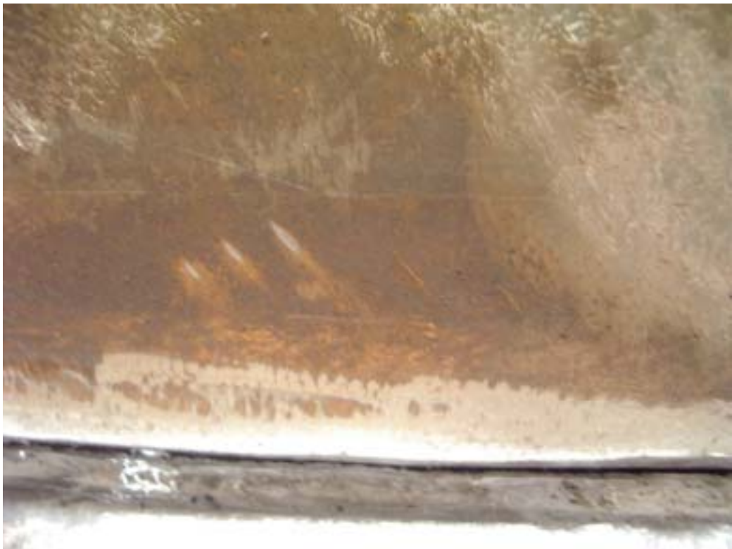
照片八：檢測基準線