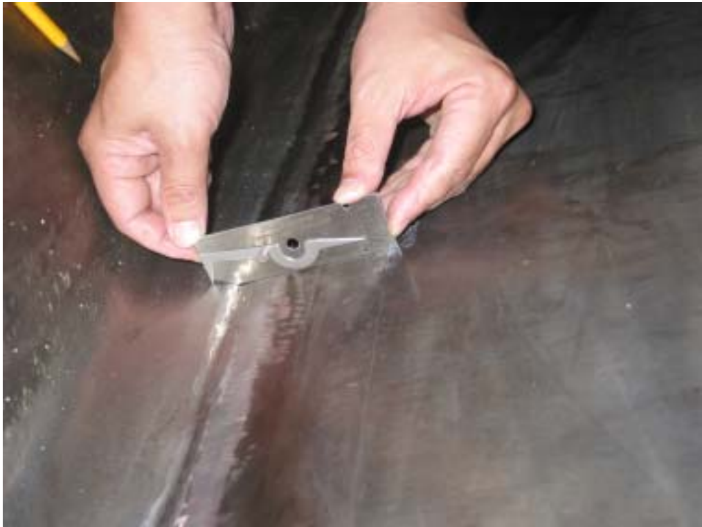
照片十六：基礎鐸道&外板 309L 防蝕覆層量測情形