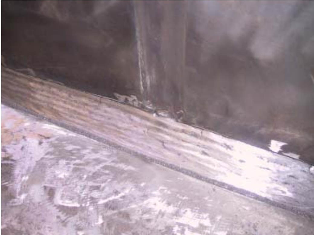
照片十四：基礎銲道研磨後情形