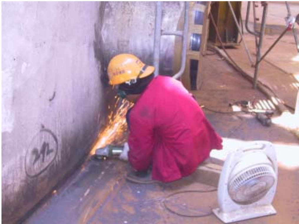
照片十三：基礎銲道研磨情形