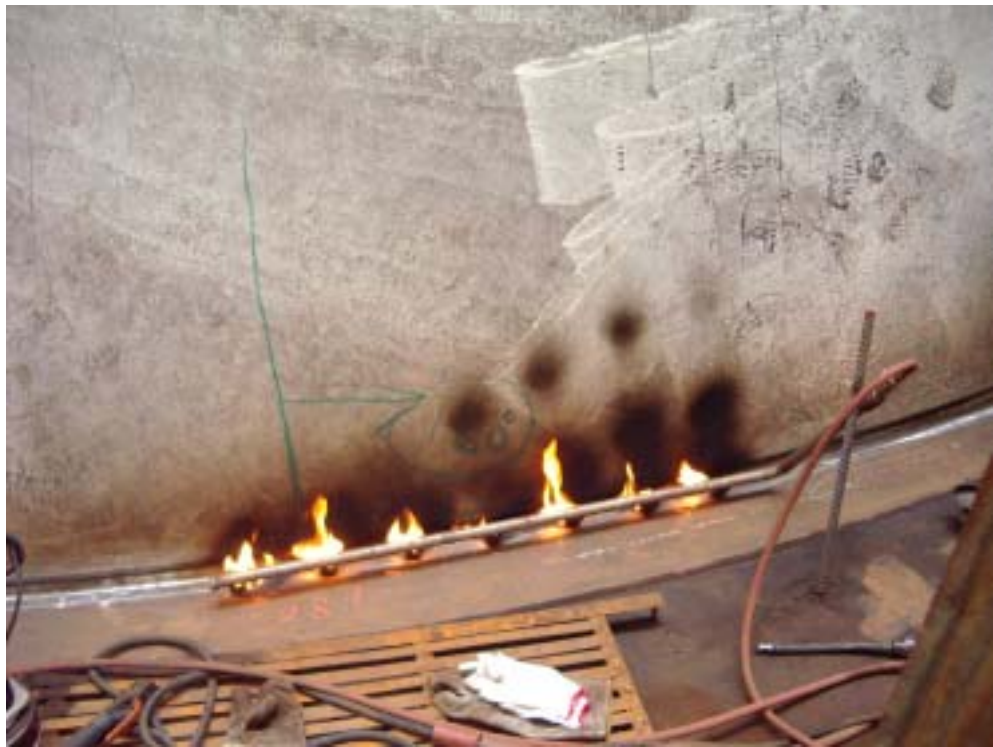
照片九：基礎鉚道預熱情形