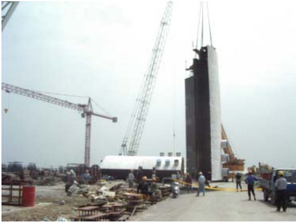
照片一：基座吊裝情形