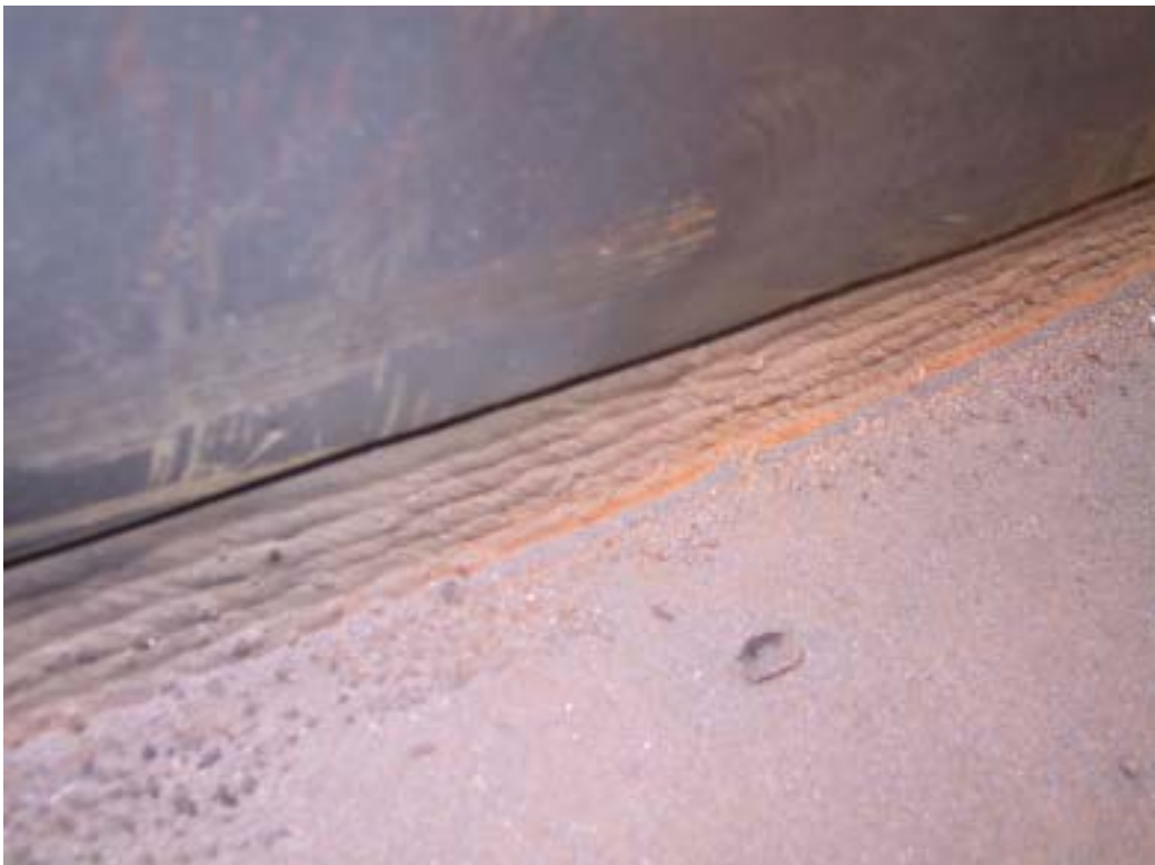
照片十二：基礎鉚道鉚後情形