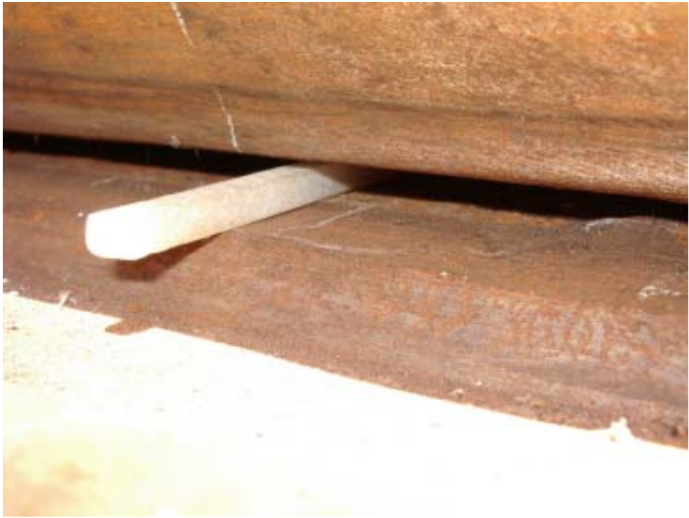
照片三：基礎鐸道背襯鈑與基鈑間隙過大情形(一)