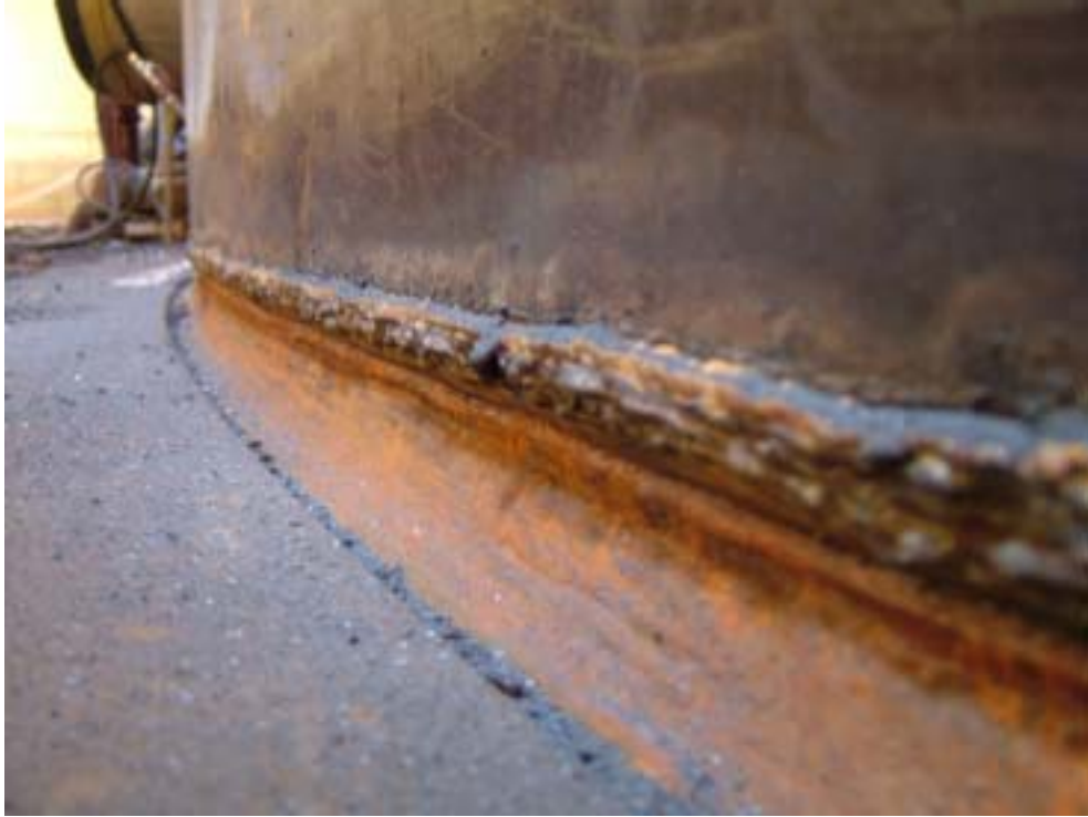
照片十五：基礎鐸道 E7018 填料及 309L 防蝕覆層補鐸後情形