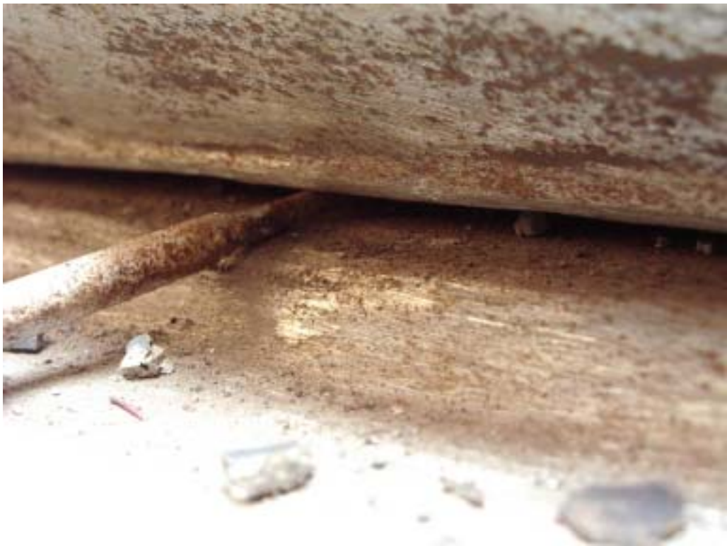
照片四：基礎鐸道背襯鈑與基鈑間隙過大情形(二)