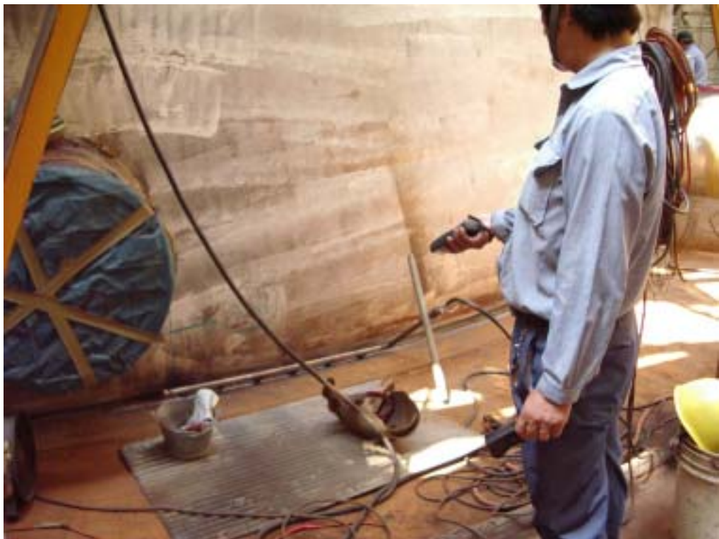
照片十：基礎鉚道預熱溫度量測情形