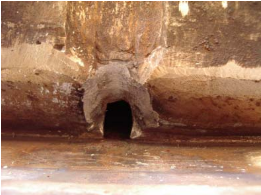
照片六：垂直鐳道和基鈹相交處凹洞磨開後情形