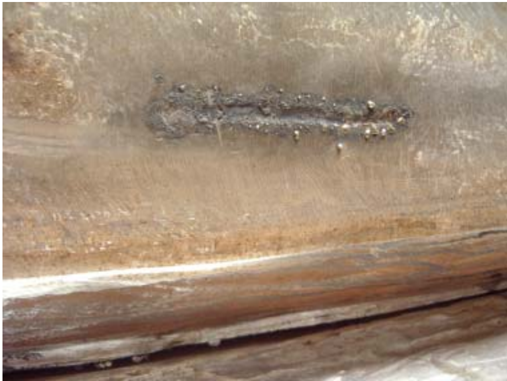
照片七：RS13 區塊不銹鋼覆面遭電弧擊傷情形