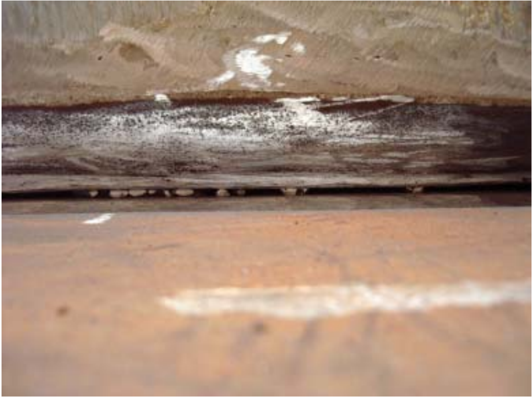
照片五：基礎鐳道根部遭金屬屑及鐳渣塞入情形