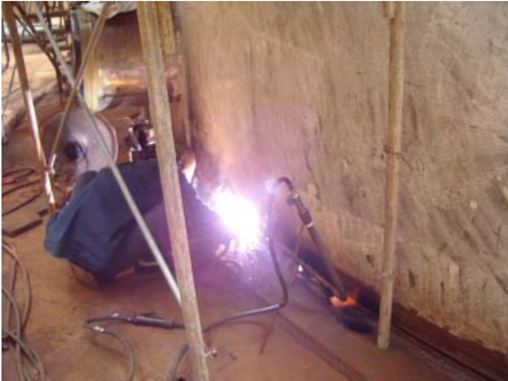
照片十一：基礎鉚道鉚接並同時持續預熱情形