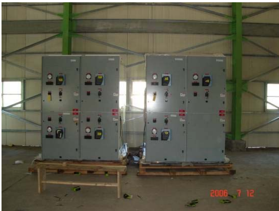
照片一：4.16kV 裝甲開關箱拆箱檢驗（一）