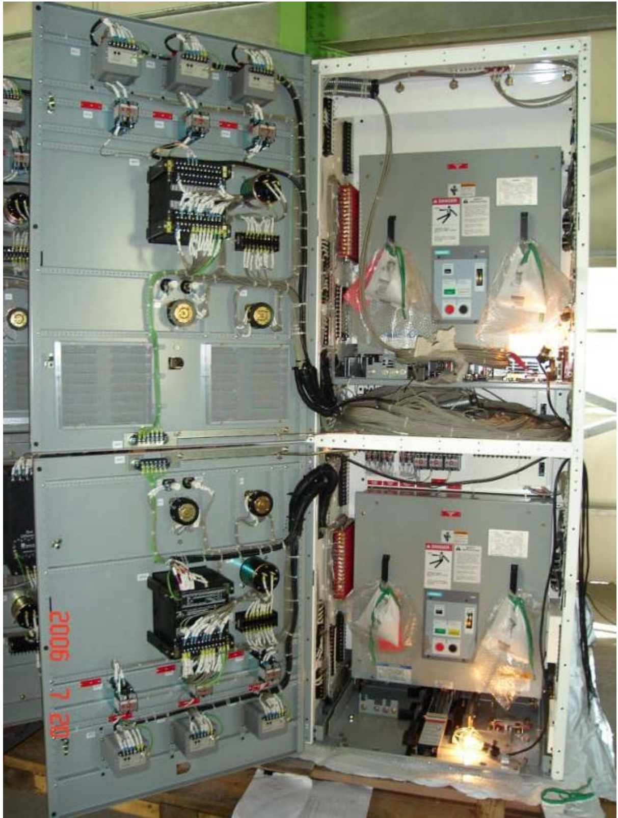
照片三：4.16kV 裝甲開關箱拆箱檢驗（三）