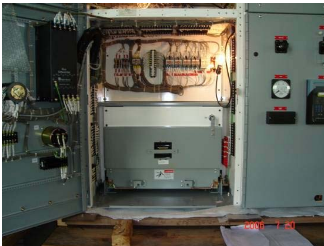
照片二：4.16kV 裝甲開關箱拆箱檢驗（二）