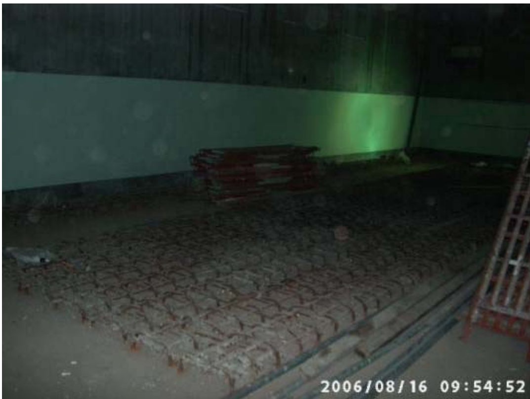
照片七：一號機反應器廠房 EL.4800 牆面粉刷尚未完成