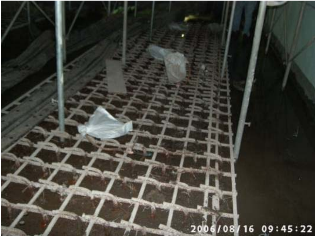
照片六：一號機反應器廠房 EL.4800 樓板積水現象及設備基礎尚未施作