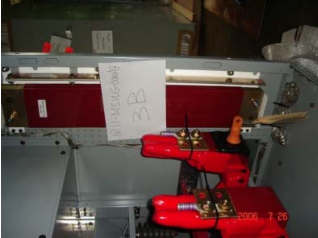
照片四：4.16kV 裝甲開關箱拆箱檢驗（四）