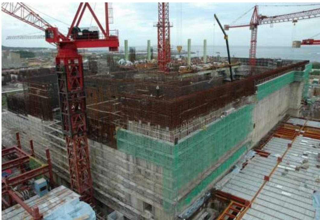
照片四：一號機汽機廠房施工現況