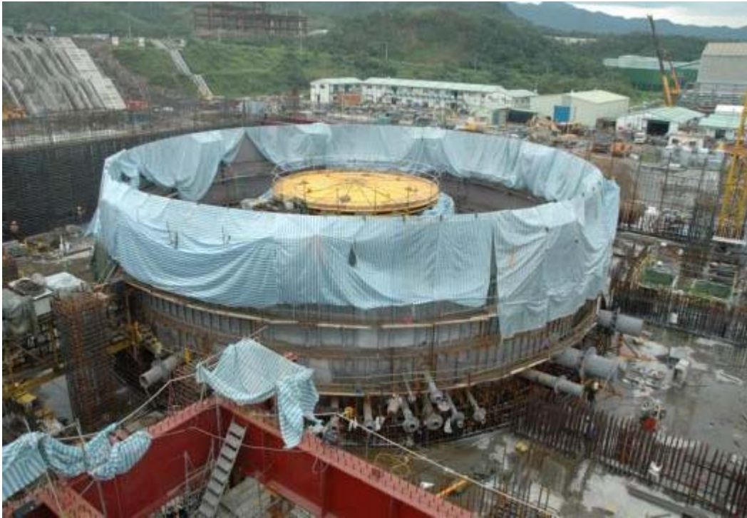
照片五：二號機反應器廠房施工現況