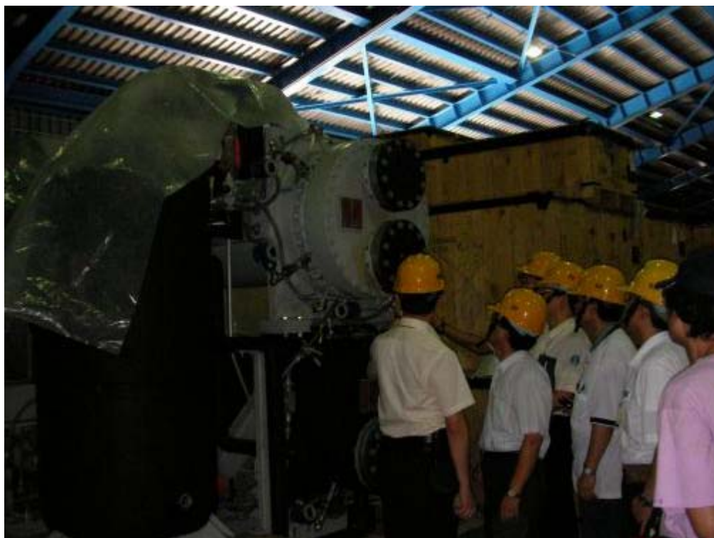
照片九：視察 ECW Chiller 倉儲情形