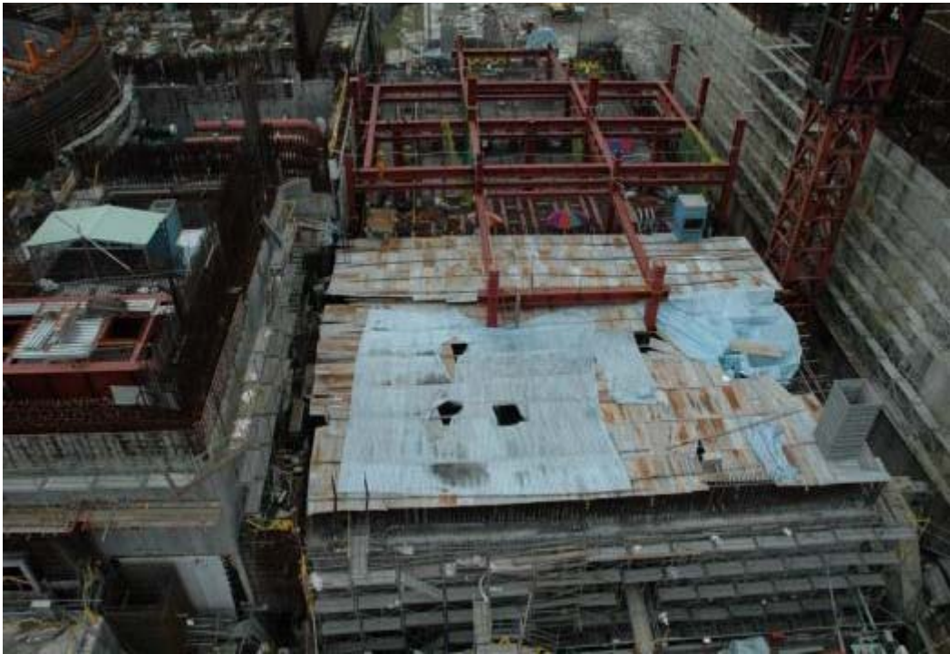
照片三：一號機控制廠房施工現況(EL12300)