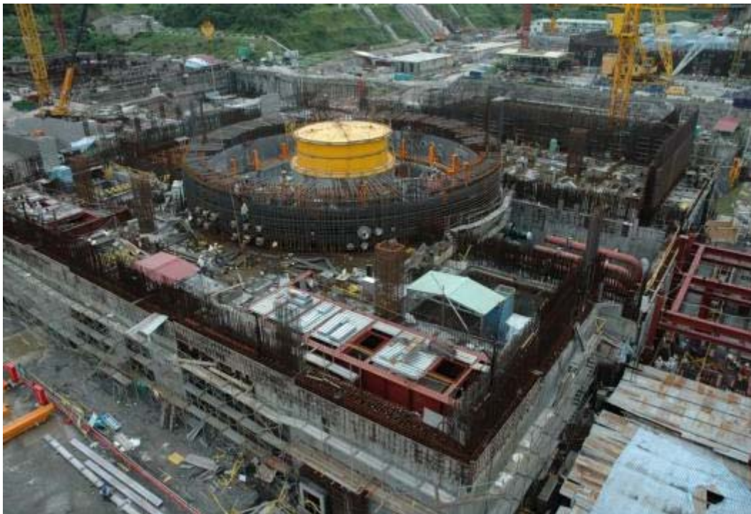
照片二：一號機反應器廠房施工現況