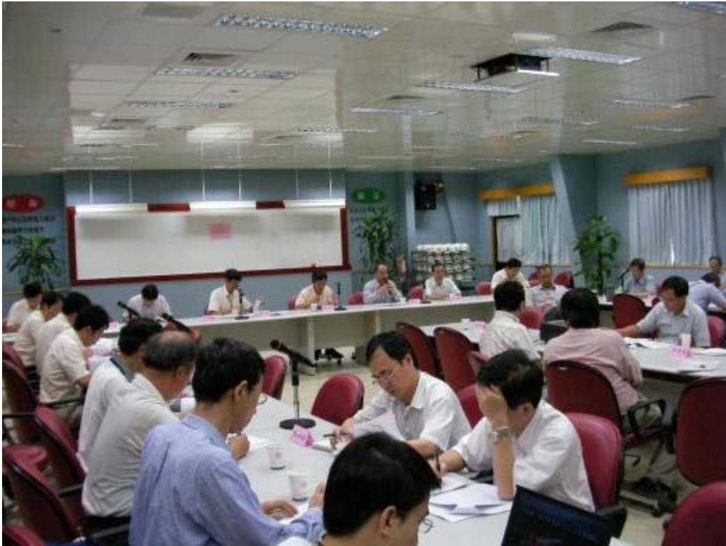
照片一：視察前會議