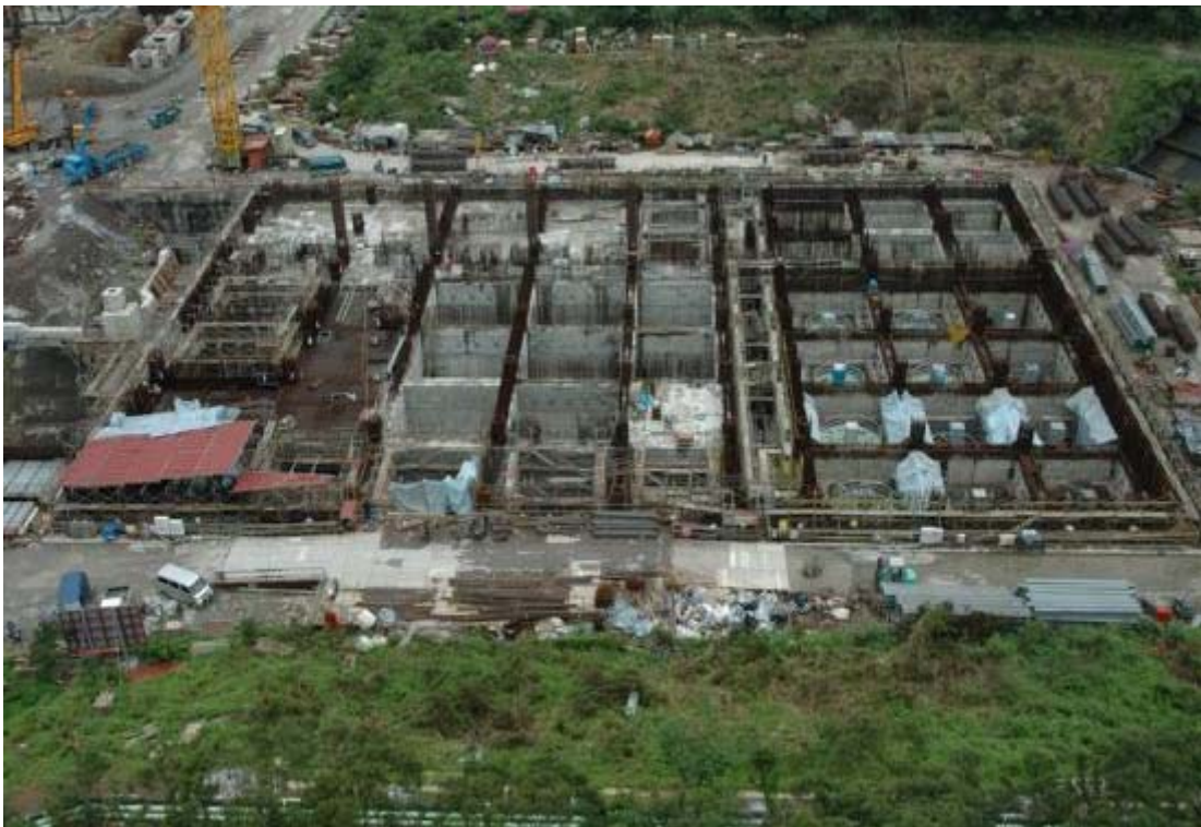
照片八：核廢料廠房施工現況