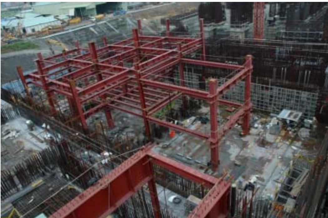
照片六：二號機控制廠房施工現況