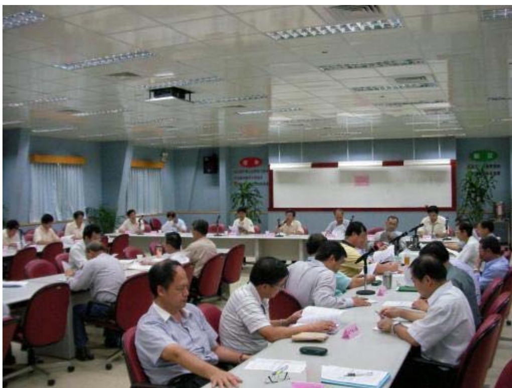
照片十：視察後會議情形