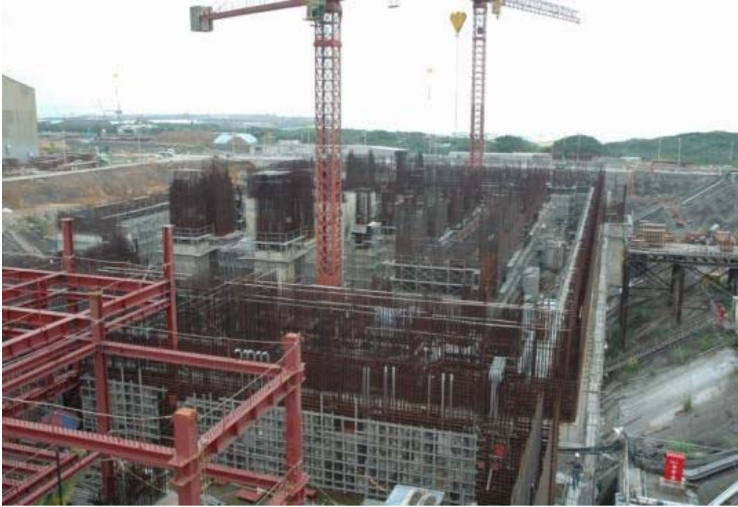
照片七：二號機汽機廠房施工現況