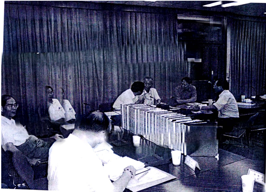
照片四：核能工程品質作業查證（二）