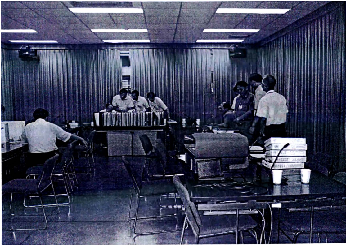
照片三：核能工程品質作業查證（一）