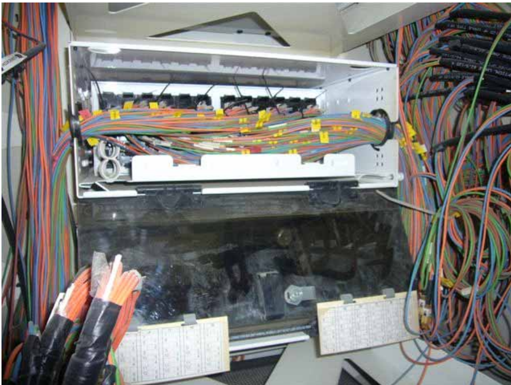
一般盤櫃內光纖未理線凌亂情形