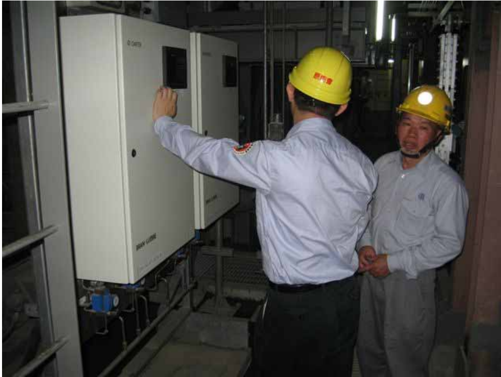
本會視察員於現場詢問核四廠設備電氣設備運轉情形