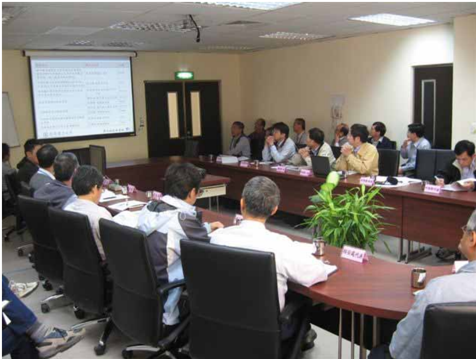
核四廠與本會視察人員召開視察前會議情形