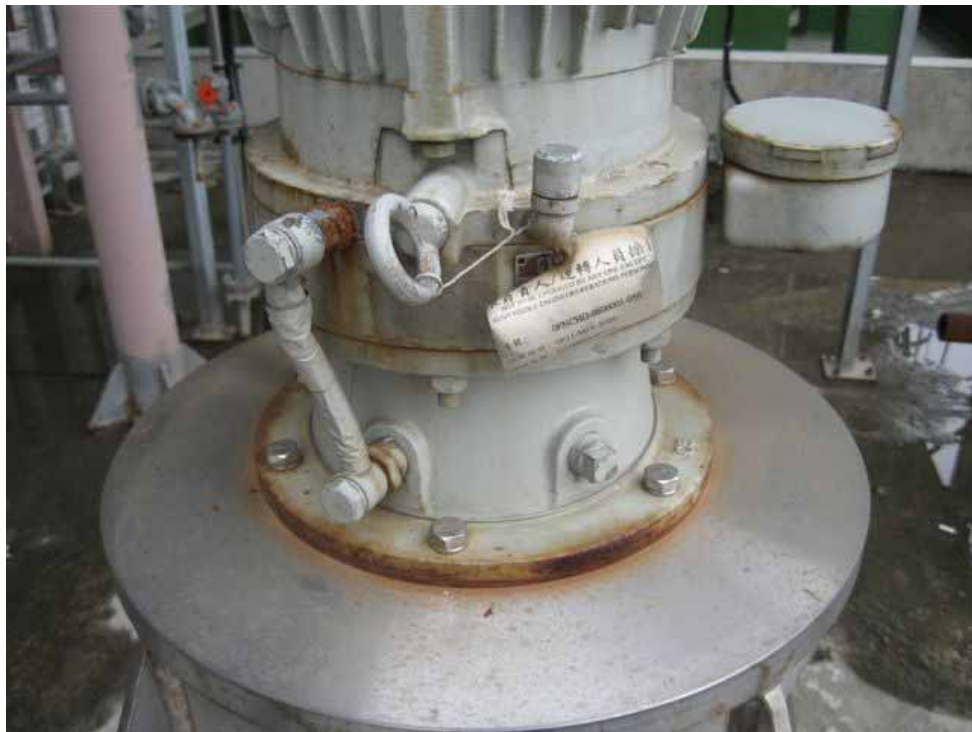
核四廠水廠露天儲置設備鏽蝕情形