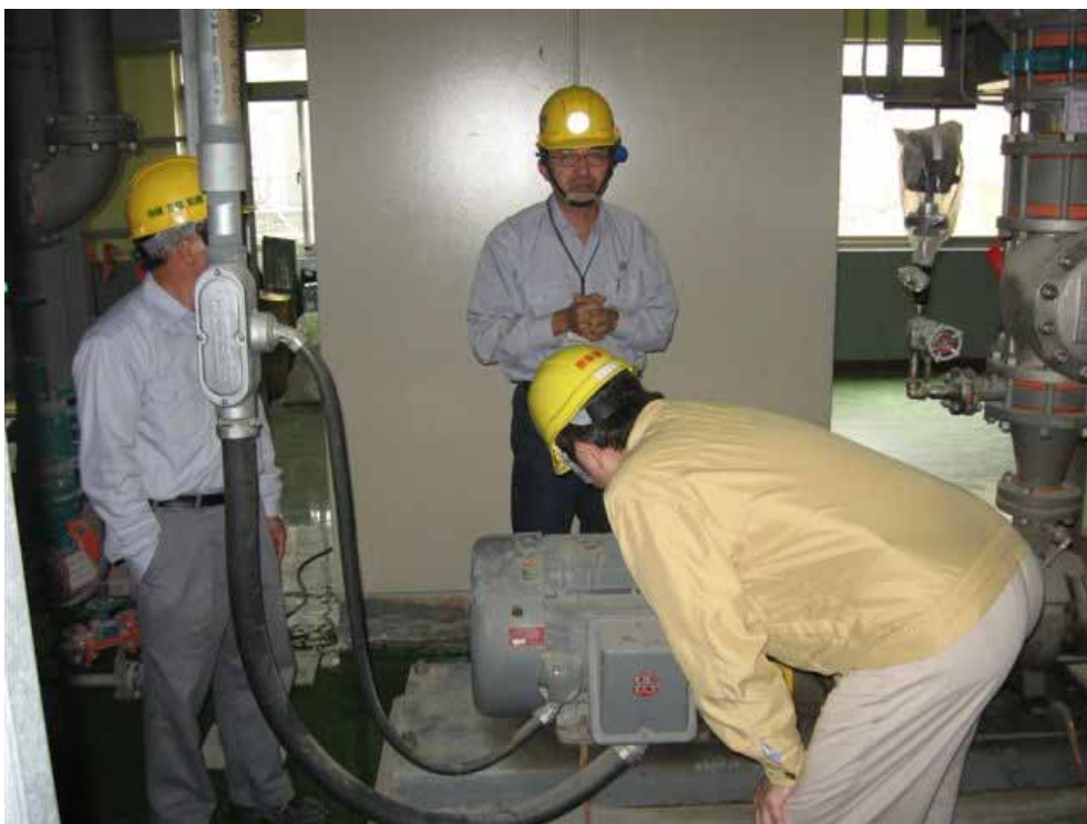
本會視察員於現場查證核四廠設備情形