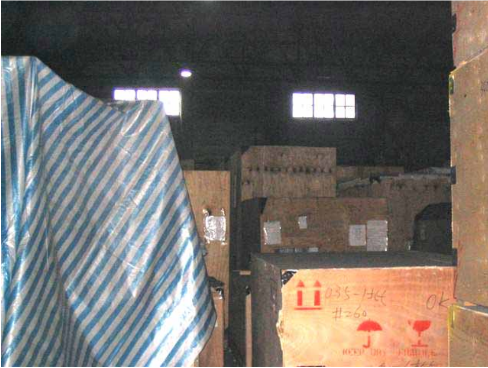
照片十一、基隆港 30 號碼頭倉庫設備倉儲情形