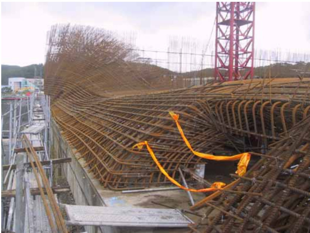
照片六、一號機汽機廠房東側鋼筋傾倒情形(二)