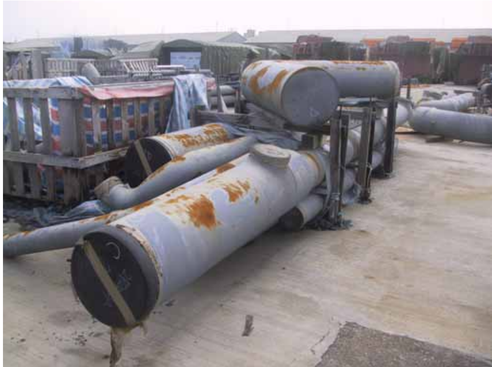
照片四、露天儲存場器材現況