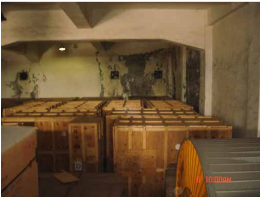
照片十、基隆港光華倉庫設備倉儲情形(二)