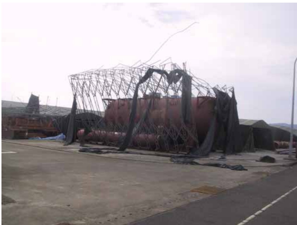
照片二、海棠颱風露天儲存棚受損情形(二)