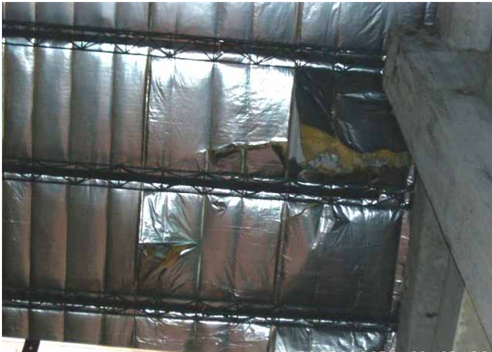
照片十二、基隆港 30 號碼頭倉庫屋頂破損修補後情形