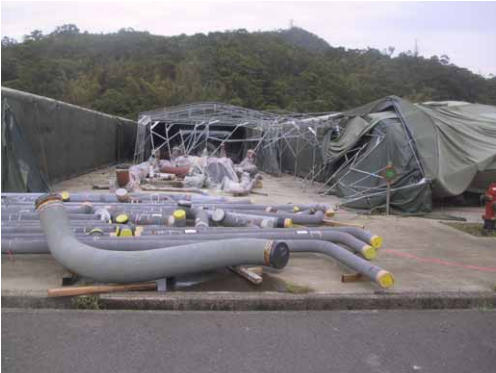
照片三、海棠颱風露天儲存棚受損情形(三)