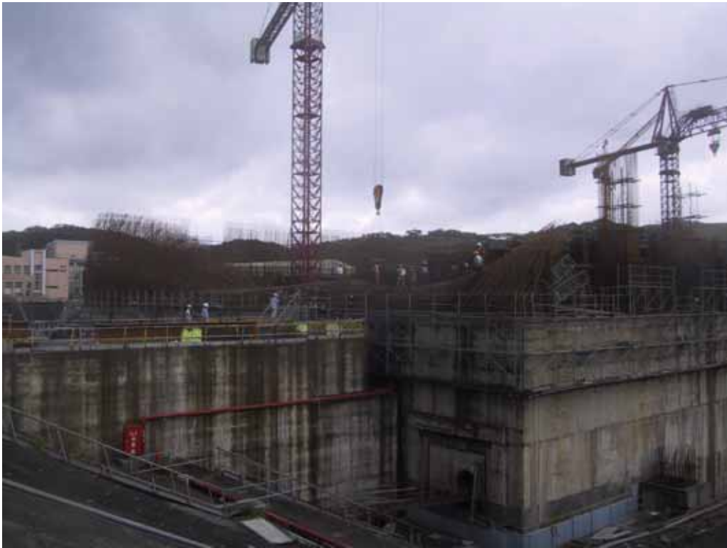
照片五、一號機汽機廠房東側鋼筋傾倒情形(一)