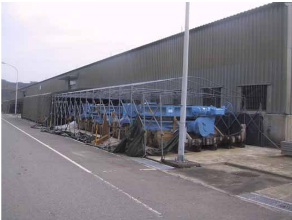
照片一、海棠颱風露天儲存棚受損情形(一)