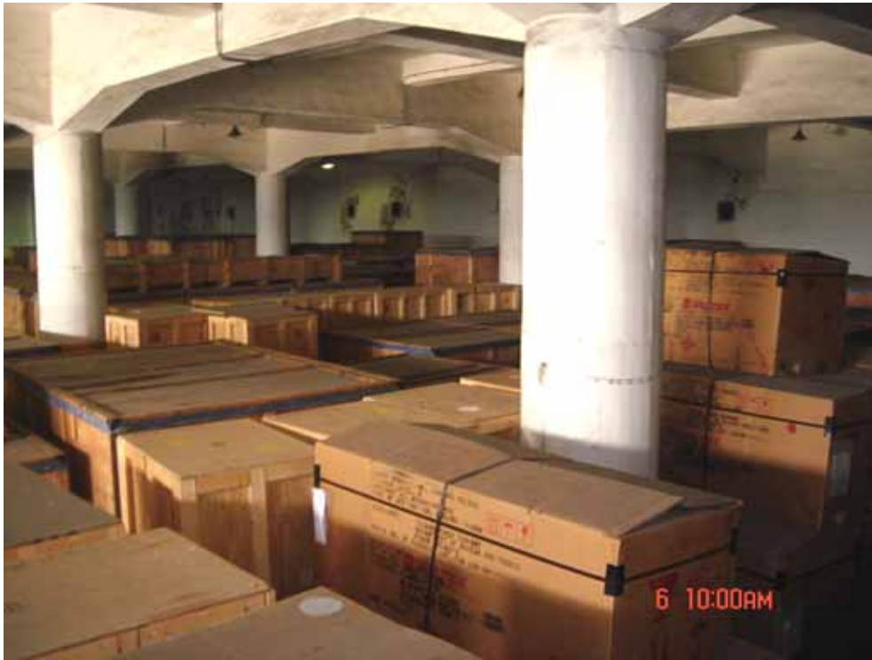
照片九、基隆港光華倉庫設備倉儲情形(一)