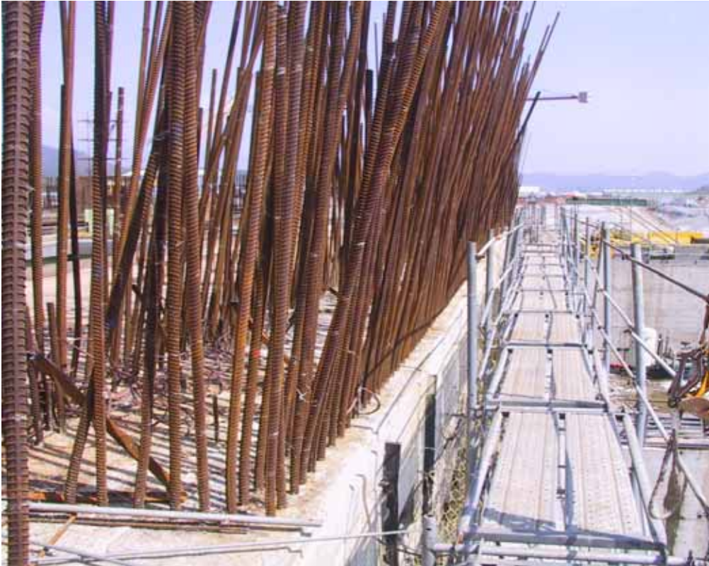
照片七、一號機汽機廠房東側傾倒鋼筋復原情形